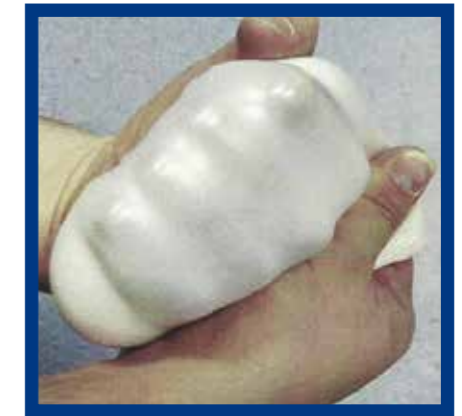
Reißfestigkeit und Elastizität